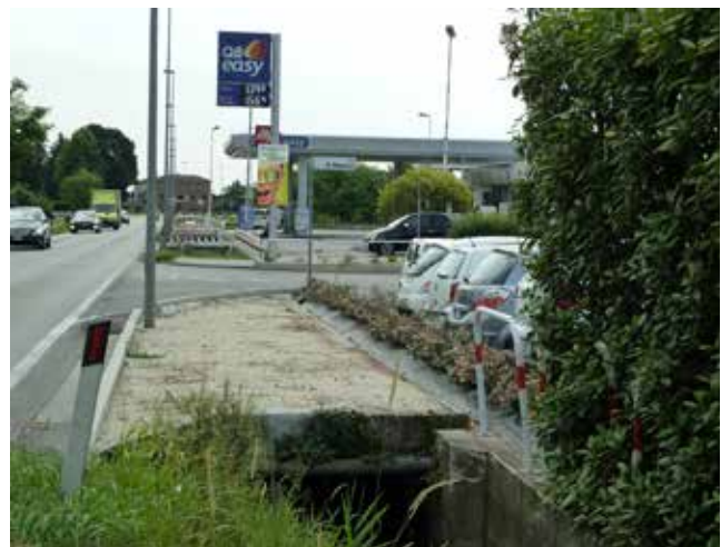
Prima dei lavori (a sinistra) e dopo i lavori (a destra)