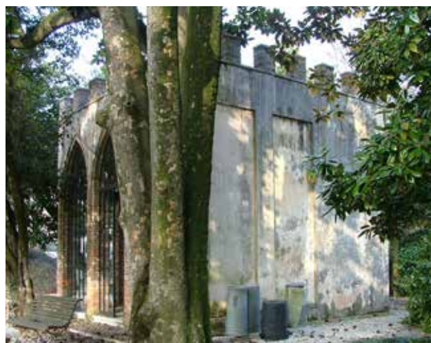
Prima dei lavori (sopra) e dopo i lavori (sotto)

Importo complessivo stanziato: € 32.000,00. Durata dei lavori: tre mesi. In seguito agli interventi di manutenzione e restauro l'Amministrazione aprirà la voliera non solo durante le proiezioni di film estivi ma anche durante i giorni di apertura del parco, ospitando un piccolo bar/ristoro e installando nell'area nuovi giochi per i bambini e dei tavoli con sedie.