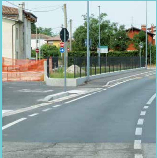
Le foto di via Crearo prima (sinistra) e dopo (destra) l'intervento di manutenzione e messa in sicurezza dell'incrocio